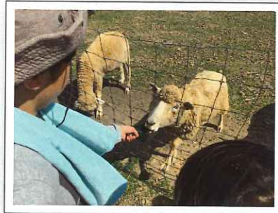
外出(ひつじみかん牧場)