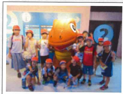
遠足(白浜エネルギーランド)